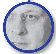
PERSONALISIERUNG: Gesichter zeigen, Köpfe vorstellen, Profil durch Meinung. Im Interview kommen „handelnde Menschen“ zu Wort.

nicht nur „intern“ immer weniger Anklang, sondern vor allem auch außerhalb kaum noch Leser. Gerade, wenn mit dem neu gestalteten Blatt auch Gruppen erreicht werden sollen, die nicht die gesundheitspolitischen Positionen der AOK teilen, müssen sie sich regelmäßig in dem neuen Medium wiederfinden – schon um der eigenen Glaubwürdigkeit willen. Zu Ende gedacht heißt das: gesundheitspolitisches Diskussionsforum statt bloßes AOK-Verkündblatt.