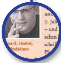
EMOTIONALISIERUNG: Der Chefredakteur schafft im Editorial Lesernähe. Er moderiert Themen an und berichtet aus dem Redaktionsalltag.