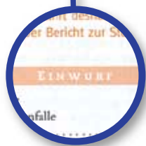
STRUKTURIERUNG: Mehr Leserführung durch neue Hefsegmente, klare Hefstruktur. Typo, größere Seitenzahlen sorgen für schnelle Orientierung.