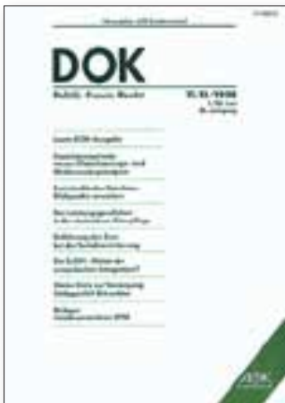
Nach mehr als 80 Jahren Erscheinen zugunsten von G+G eingestellt: DOK, das „Verlautbarungsorgan“ der AOK.